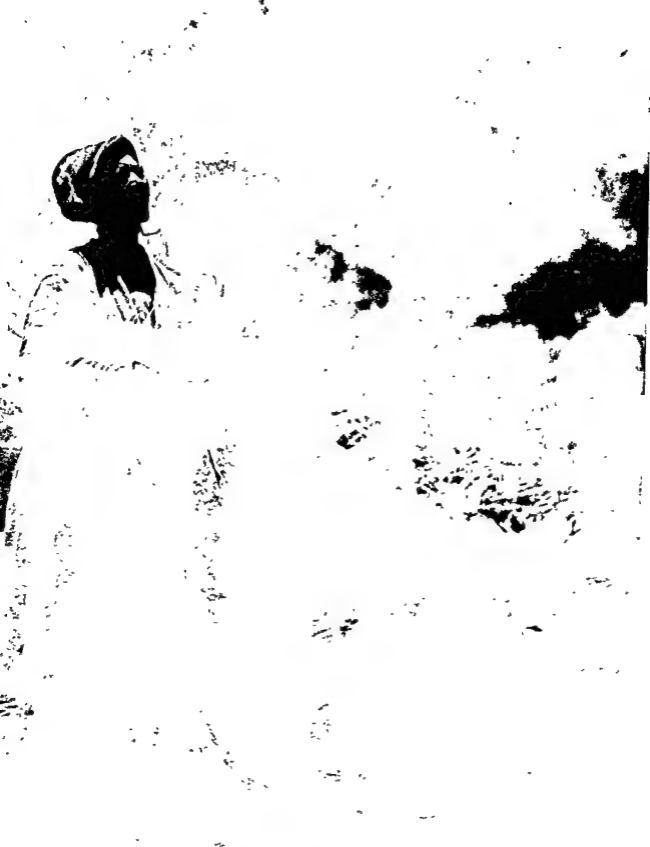
साहीब के लामा